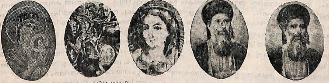
ഒരു വിശ്വാസി, ബറോഡ, മത്തായി.